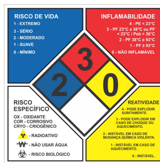
Diagrama de Hommel

SISTEMA DE CLASSIFICAÇÃO UTILIZADO: NATIONAL FIRE PROTECTION ASSOCIATION: NFPA 704.